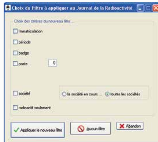
Journal des évènements avec filtre prédéfini