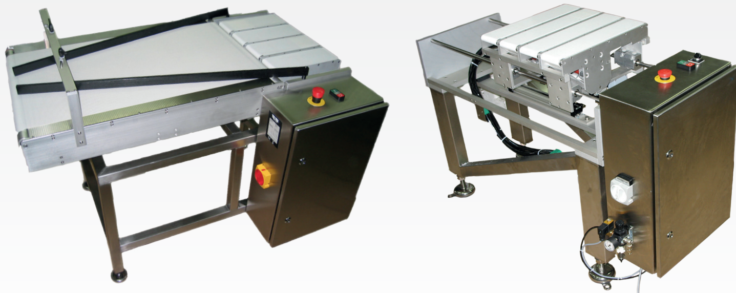
Tapis alignement produit pour combinaison 4 en 1 avant trieuse